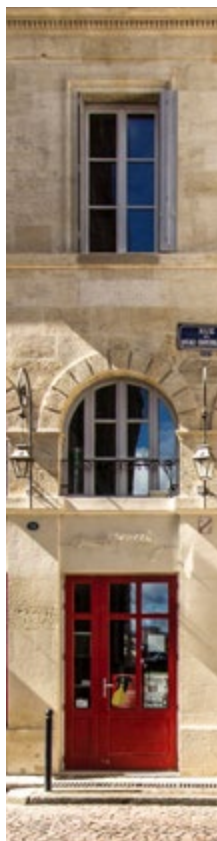
(1) Meilleursagents.com, (2) Century 21, (3) Indice brut hors loyers.

La tendance des prix de l'immobilier s'est confirmée au premier semestre avec une hausse modérée de 0,9% au plan national (1) .